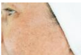
Felületes epidermális pigmentációs elváltozások